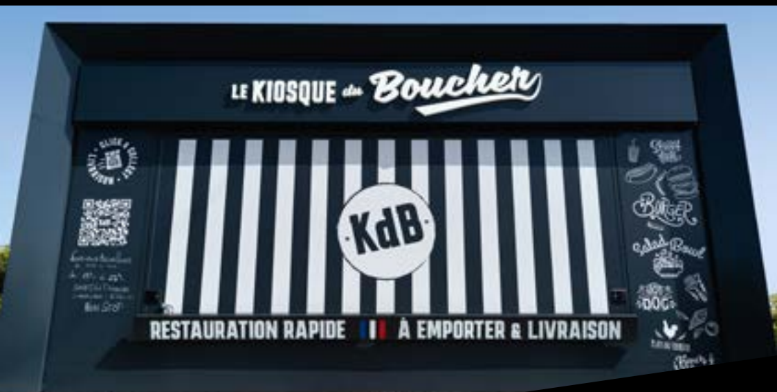
Installation du Kiosque du Boucher en satellite du restaurant La Boucherie Trignac (44)

Un projet, un emplacement ? Bénéficiez de l'appui d'un groupe expérimenté et structuré pour aller conquérir un nouveau segment de marché.